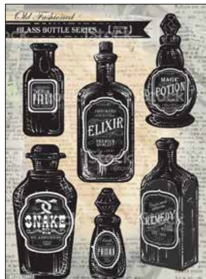
Tabell 1. Exempel på tidig indelning av läkemedel

Ett annat sätt att dela upp läkemedel i grupper utgår från den s.k. ATC-koden (Anatomical Therapeutic Chemical classification system). Den infördes i Sverige 1988/89 i standardverken FASS, Apotekens läkemedelsregister och Läkemedelsboken och består av 14 huvudgrupper och börjar med gruppen Matsmältningsorgan och ämnesom-sättning. Den gäller med vissa språkliga justeringar och nya undergrupper fortfarande i FASS. Nyligen har undergruppen JO7BX03 tillkommit – vaccin mot covid-19. Koden utvecklades som en följd av nordiskt samarbete kring varunummer för läkemedel av i första hand partihandeln Norsk Medicinaldepot . Den blev klar 1976 och antogs av WHO sex år senare som norm för klassificering över hela världen. Innan ATC-koden infördes hade en farmakologisk-klinisk indelning gällt för läkemedel i Sverige, ursprungligen tillämpad 1931 i Medicinalstyrelsens benämningar utarbetade av den inflytelserika läkaren Malte J. J. Ljungdahl . Några år senare övertogs indelningen i den spridda recepthandboken Pharmaconomia Svecica ( Nominan eller NOM ) och började med gruppen Medel mot sjukdomar i andningsapparaten . Tidigare spridda böcker om läkemedel som Terapeutisk recepthandbok (1894) och Vademecum (1904-1932) hade tillämpat alfabetisk ordning. Viljan att gruppera läkemedel efter terapeutiska egenskaper går dock långt tillbaka i tiden. I en avhandling från 1752, vilken Linné satt ordförande för, görs en indelning i 13 grupper, se Tabell 1 i vilken några