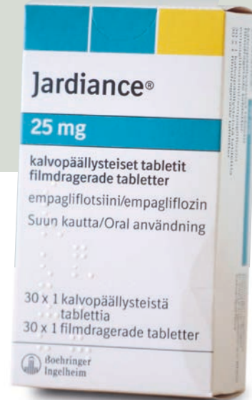
Ett av Boehringer Ingelheims nyare läkemedel är SGLT2-hämmaren Jardiance mot diabetes typ 2.